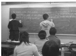
■授業風景(英作文指導)