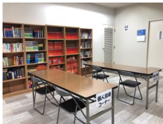
■本棚と個人指導コーナー